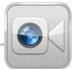
Het icoon van Facetime.